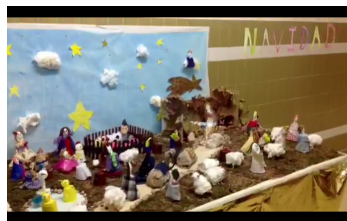
Belén de 5º EP a 1º ESO.